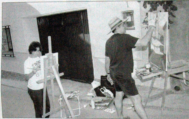
Pintores de todas las edades immortalizaron los rincones de Laperdiguera.