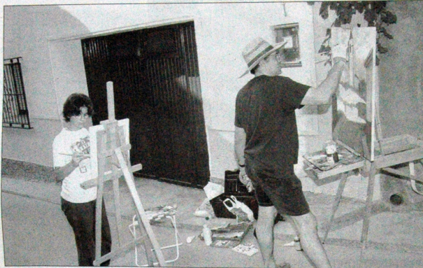
Pintores de todas las edades immortalizaron los rincones de Laperdiguera.